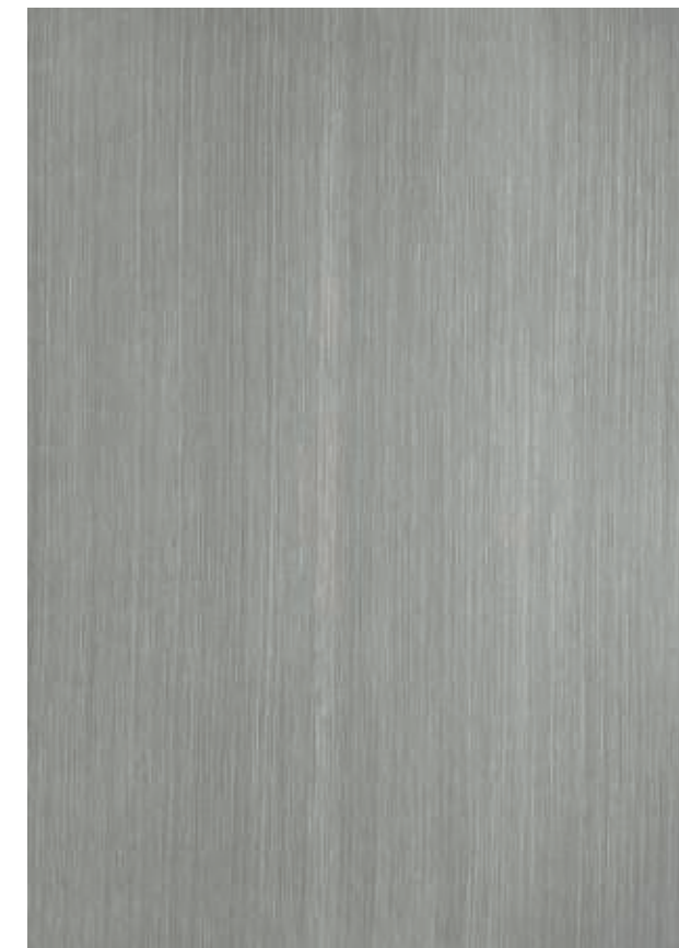
NO 12 Silverizing senkrecht abgezogen