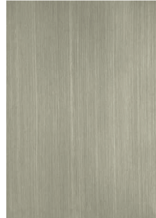
NO 76 Glam Rock senkrecht abgezogen